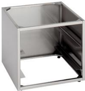
Zmywarki profesjonalne - Akcesoria do zmywarek - Podstawy pod zmywarki